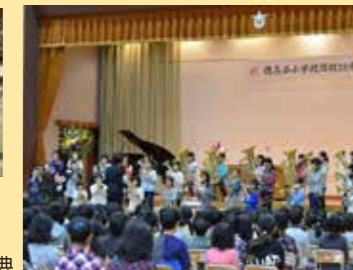
開校 30 周年記念式典