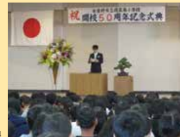
開校 50 周年記念式典